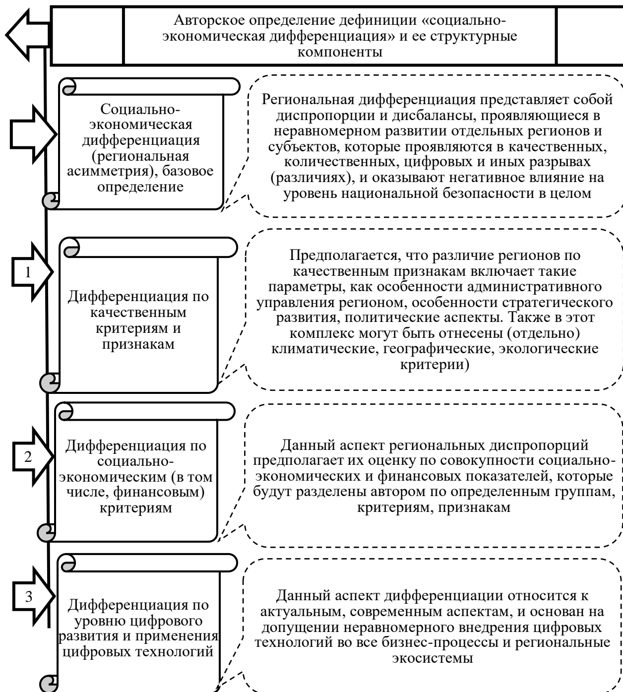
Рис. 2. Авторское определение ключевой исследовательской дефиниции «социально-экономическая дифференциация» или региональная асимметрия

Следовательно, после практической апробации методики возможно рекомендовать ее к практическому применению: Министерству экономического развития (для организации и управления всеми социально-экономическими аспектами развития государства в контексте реализации политики национальной безопасности), органам местного самоуправления отдельных регионов и территорий, в том числе регионам с наиболее неблагоприятной ситуацией в сфере государственного управления и социально-экономического развития.