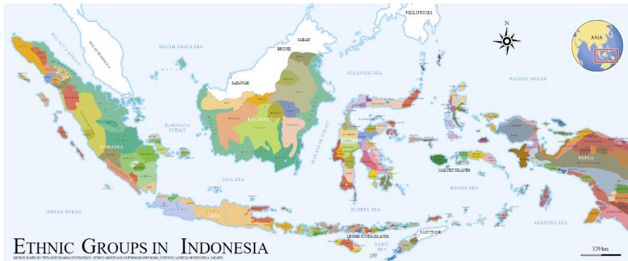
Рисунок 2. Карта этнических групп Индонезии

До британской колонизации, Сингапур был небольшим рыбацким поселением, населенным малайскими и индонезийскими племенами. В течение нескольких веков Сингапур был частью малайских султанатов, таких как Джохор и Риау.