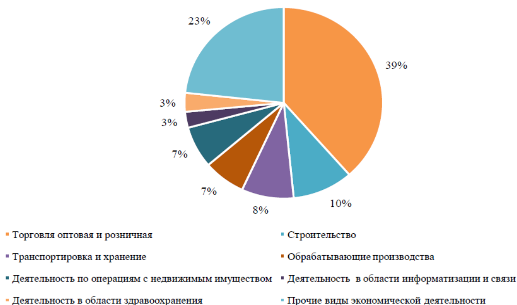
Рисунок 1. Структура малых и средних предприятий по видам экономической деятельности

Малые предприятия играют значительную роль в инновационном развитии, способствуя научно-техническому прогрессу, их структура представлена на Рисунке 1. В России 39% МСП специализируются на оптовой и розничной торговле, 23% занимаются с недвижимостью. Кроме того, малые предприятия активно работают в таких отраслях, как строительство (10%), производство (8%) и добыча полезных ископаемых (1%). Каждая из этих сфер вносит свой уникальный вклад в экономическое развитие страны, способствуя разнообразию и устойчивости национального бизнес-сектора [6].