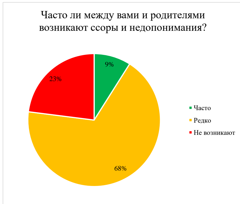
Рисунок 3. Результаты опроса родителей

По результатам опроса родителей (Рисунок 3, Рисунок 4) ссоры и недопонимания возникают, но у 68 % опрошенных это происходит редко. В подавляющем большинстве (68% опрошенных), ссоры и недопонимания возникают из-за неисполнение домашних обязанностей.