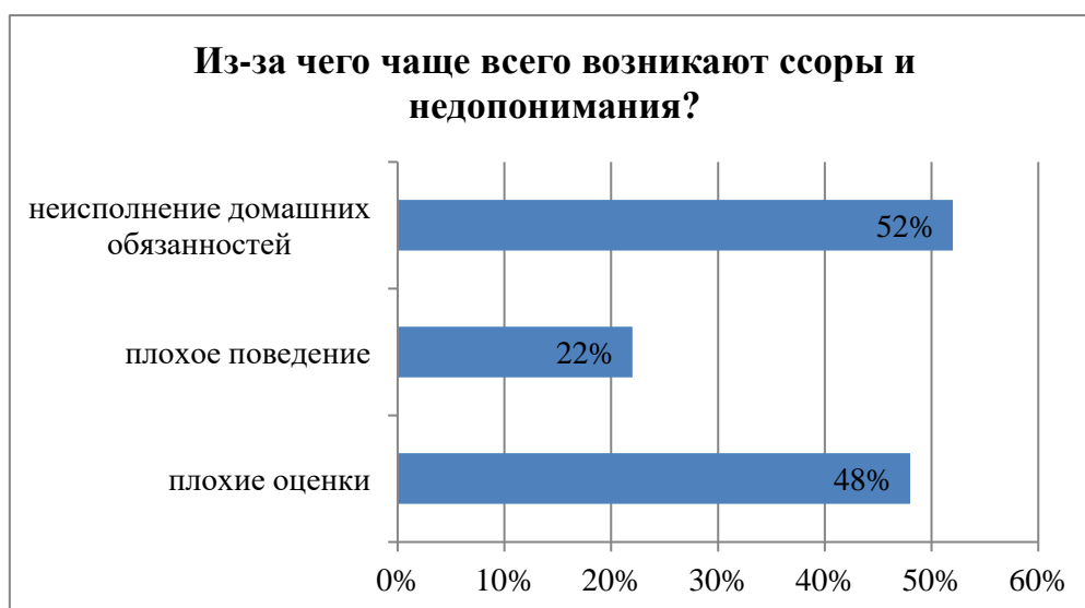
Рисунок 2. Причины возникновения ссор и недопониманий по мнению детей