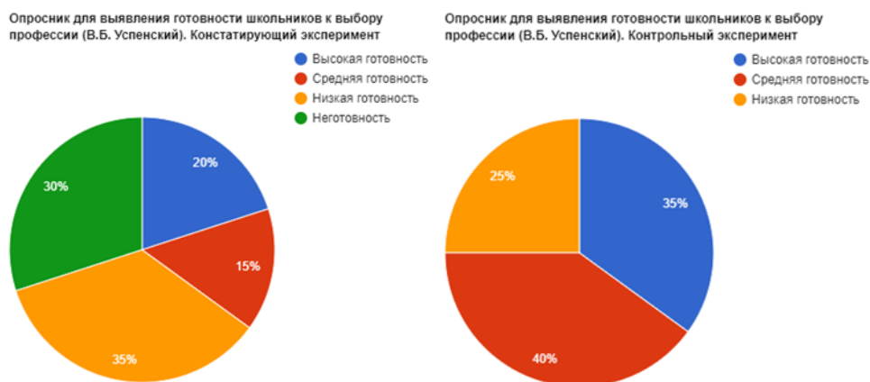
Рисунок 2. Сравнительные результаты

Высокая готовность к выбору профессий увеличилась с 20% до 30%, средняя готовность изменилась с 15% до 40%, низкая готовность показала снижение и составила 25% учащихся (Рисунок 2).