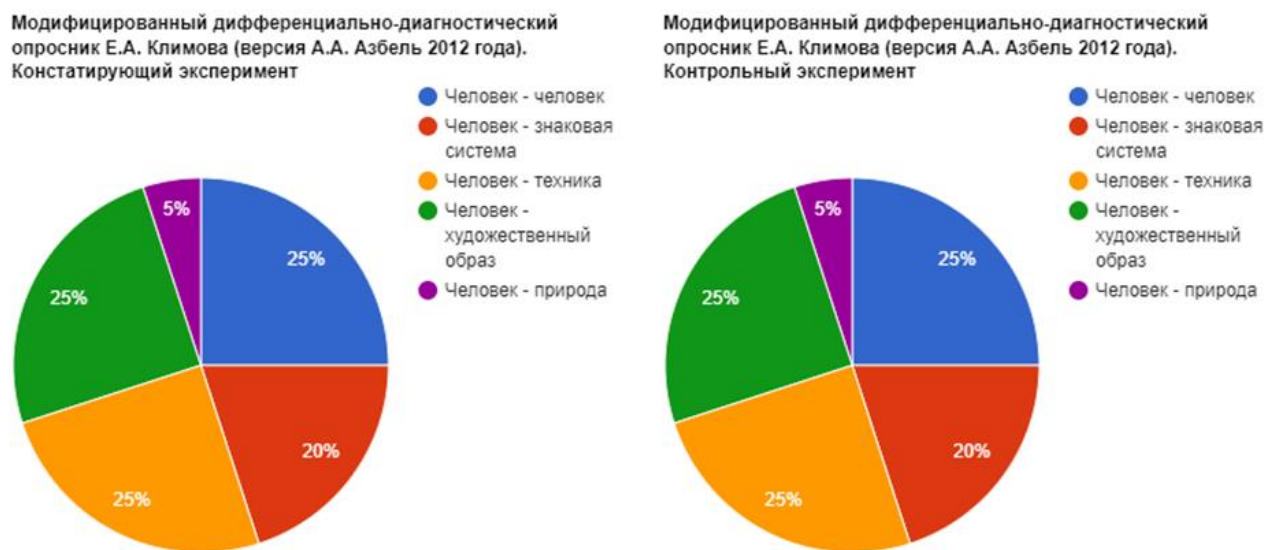
Рисунок 3. Сравнительные результаты

Результаты прохождения констатирующего теста показали, что в нашем случае 15% мотивирует престиж, 35% - заработок, 50% - реализация. После проведения формирующего эксперимента влияние мотива заработка увеличилось с 35% до 40%. Другие изменения отсутствуют. По знаковой системе Е.А. Климова оценивающей склонности, показатели оставались стабильными на протяжении всего эксперимента и не показали изменения. Показано, что склонности являются стабильными психологическими факторами, которые можно использовать для повышения готовности старшеклассников к профессиональному самоопределению (Рисунок 3).