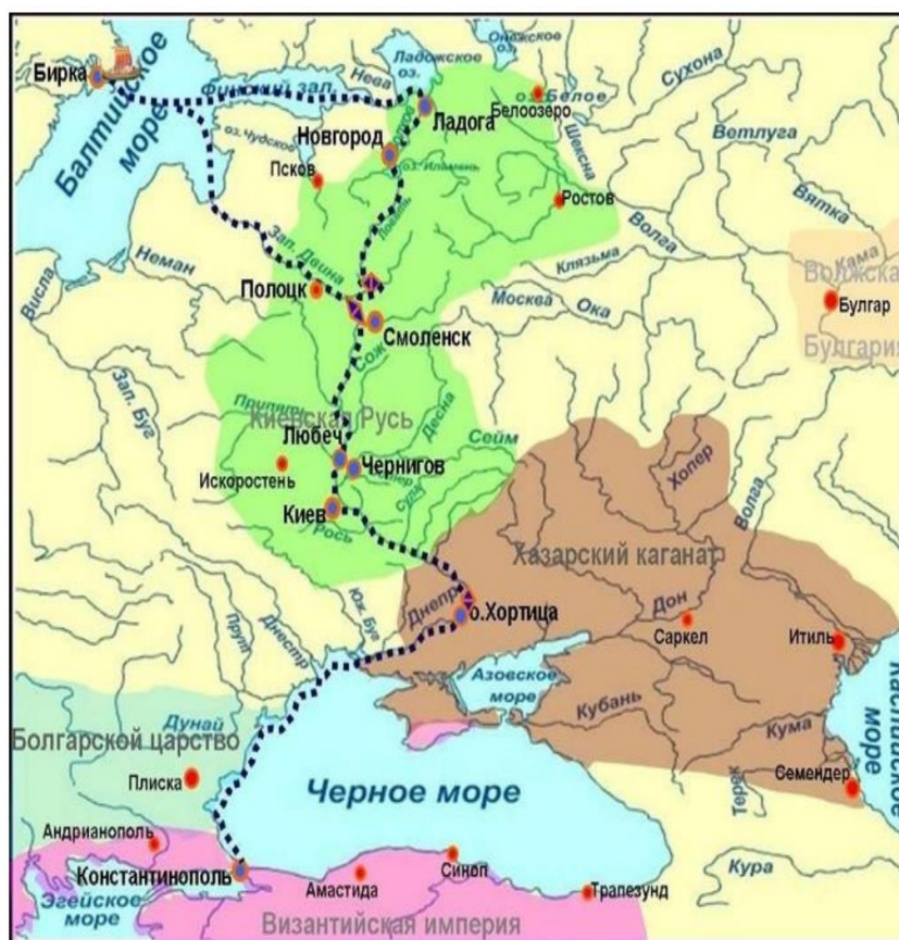
Рисунок 1. Путь «из варяг в греки»

Впервые упоминание о пути «из варяг в греки» встречается в «Повести временных лет». В ней путь описывался следующим образом: «...был путь из Варяг в Греки и из Грек по Днепру, а в верховьях Днепра — волок до Ловоти, а по Ловоти можно войти в Ильмень, озеро великое; из этого же озера вытекает Волхов и впадает в озеро великое Нево, и устье того озера впадает в море Варяжское. И по тому морю можно плыть до Рима...» [1, с. 197]. Также в Повести упоминается и иной вариант маршрута — по Западной Двине (см. рис. 1).